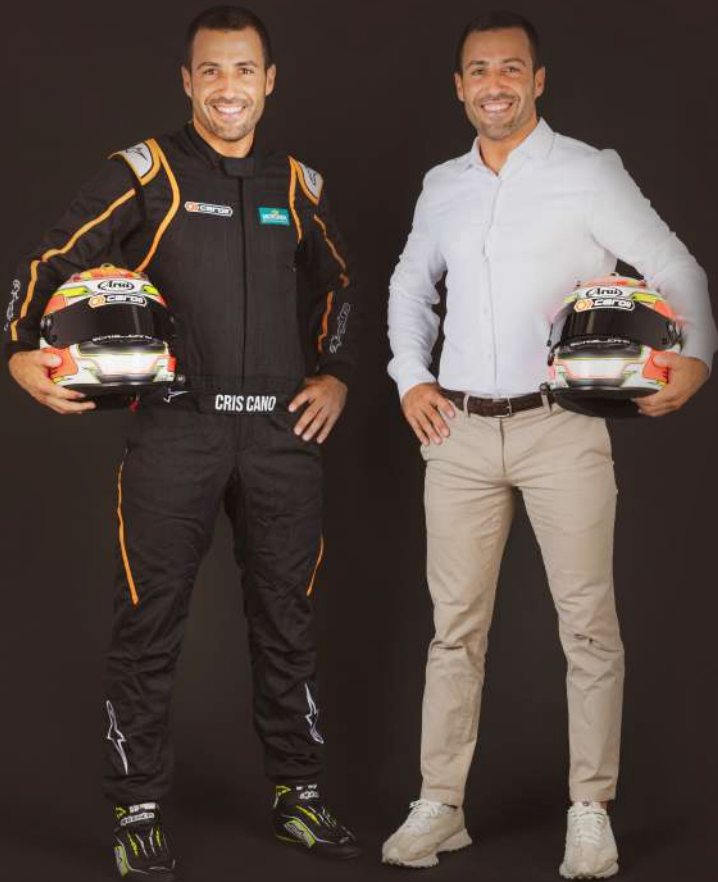
CRIS CANO @cris_cano